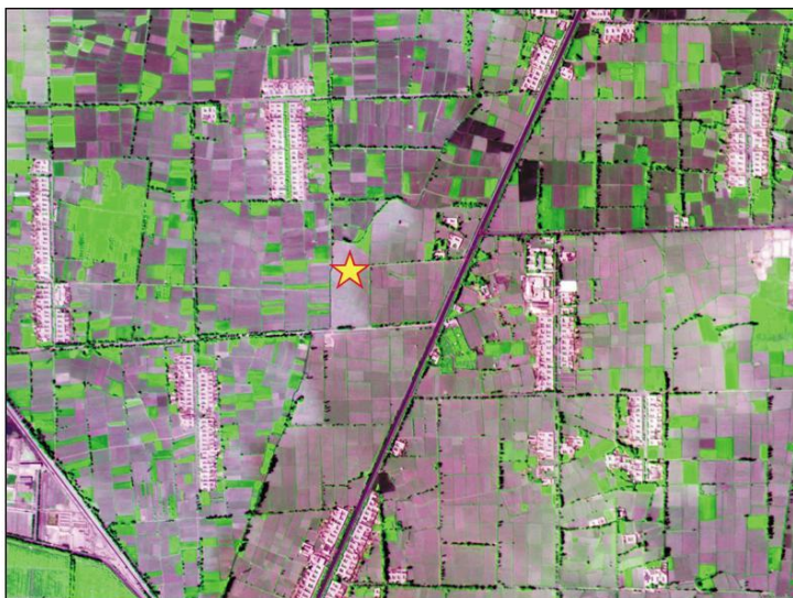
图3 盈科灌区绿洲站及周边地区多景 WiDAS 2C 级产品的镶嵌图(R: 650 nm, G: 750 nm, B: 550 nm)